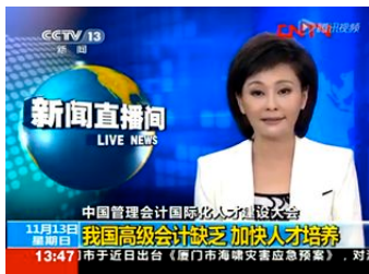
中央电视台报导我国高级会计缺乏,加快人才培养

在国际上,作为美国 COSO 委员会的创始成员及国际会计师联合会(IFAC)的主要成员,IMA 在管理会计、公司内部规划与控制、风险管理等领域均参与到全球最前沿实践。此外,IMA 还在美国财务会计准则委员会(FASB)和美国证券交易委员会(SEC)等组织中起到非常重要的作用。IMA 拥有一系列的工具和资源可以提升个人职业技能、激发个人职业潜能、甚至优化企业整体绩效。IMA 通过旗下备受全球 CFO 推崇的注册管理会计师(CMA)资格认证、高端会员人脉网络、继续教育课程、以及高标准职业道德规范实践,为 IMA 会员搭建一个资源丰富、充满活力的发展和社交平台,从而推动会员的职业生涯发展。