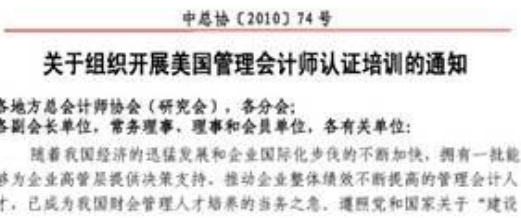
总会计师协会下发 CMA 培训通知