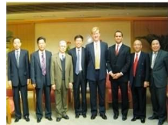
IMA 原执行总裁保罗夏曼(右四)拜访政府部门与政府官员及行业专家合影。