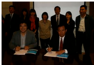
高校与国家外国专家局培训中心签署战略合作协议