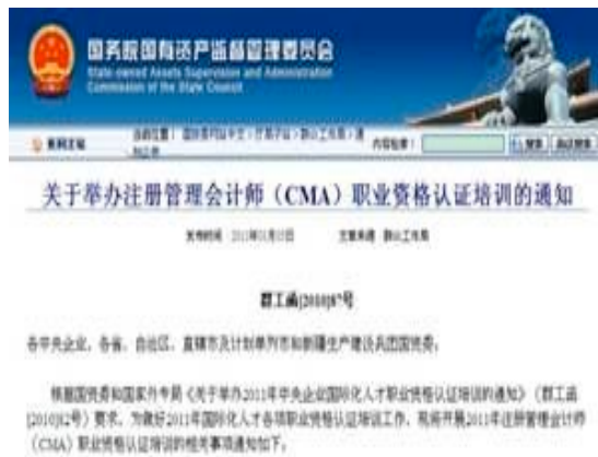
国资委下发红头文件组织 CMA 培训